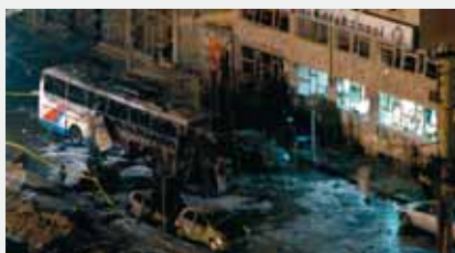
Диябакир, Турция, 1 марта 2008 г.

Кибертерроризм представляет серьезную угрозу для человечества, сравнимую с ядерным, бактериологическим и химическим оружием, причем степень этой угрозы в силу своей новизны до конца еще не осознана и не изучена.