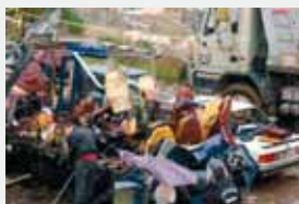
Айн-Аля, Ливан, 13 февраля 2007 г. Взрыв в христианском квартале

Лишенные поддержки иностранных государств и их спецслужб, террористы не смогут продолжать свою деятельность в прежнем объеме.