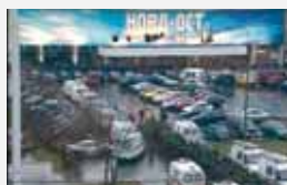
Москва, Дубровка, 25 октября 2002 г.