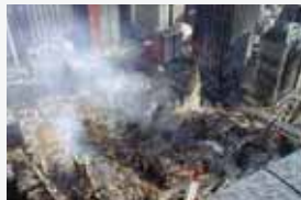
Нью-Йорк, США, 11 сентября 2001 г.

Терроризм по своим масштабам, непредсказуемости и последствиям превратился в одну из наиболее опасных общественно-политических и моральных проблем, с которыми человечество вошло в XXI столетие